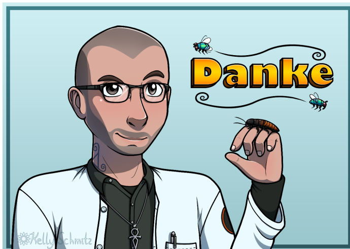
Zeichnung: BlueBead / Kelly Schmitz

Certified & Sworn In Forensic Biologist • International Forensic Research & Consulting • Internat. Kriminalbiol. Forschung & Beratung • Steuer-Nummer: 56389016749 • Umsatzsteuer-ID-Nr.: DE212749258 • E-mail forensic@benecke.com • Nur SMS: +49 171 177 1273