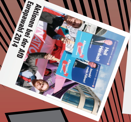
Aktionen bei der AfD Europawahl 2014