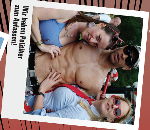
Wir haben Politiker zum Anfasen!