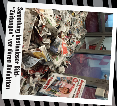
Sammlung kostenloser Bild- "Zeitungen" vor deren Redaktion