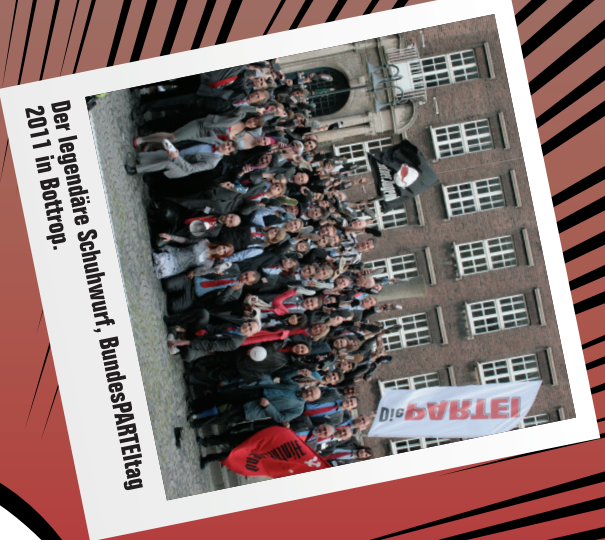
Der legendäre Schuhwurf, BundesPARTETEtag 2011 in Bottrop.