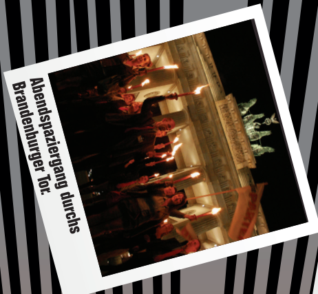
Abendspaziergang durchs Brandenburger Tor.